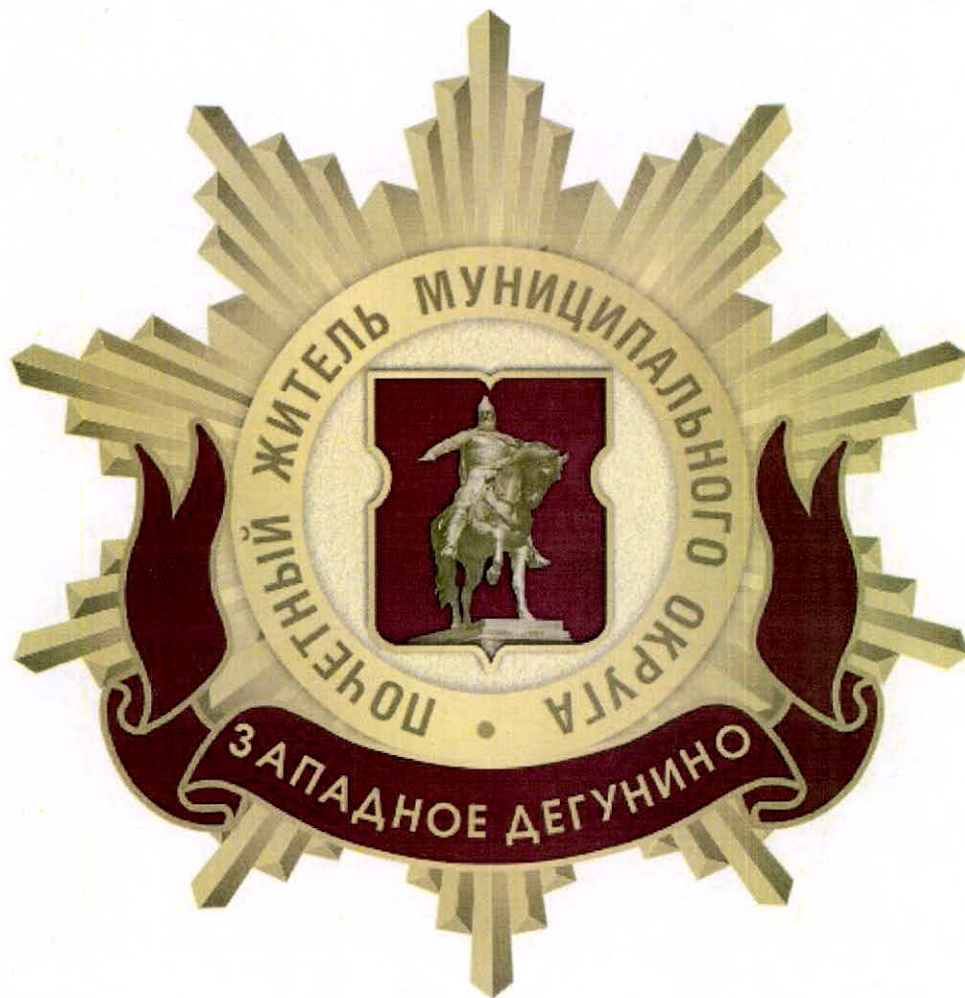
Рисунок нагрудного знака к званию «Почетный житель внутригородского муниципального образования – муниципального округа Западное Дегунино в городе Москве»

Приложение 3 к решению Совета депутатов муниципального округа Западное Дегунино в городе Москве от «20» февраля 2025 года № 2/9